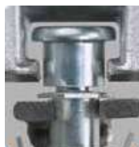
Gâche réglable en compression