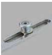
Serrure 4 galets