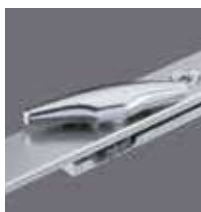
Pêne demi tour réversible